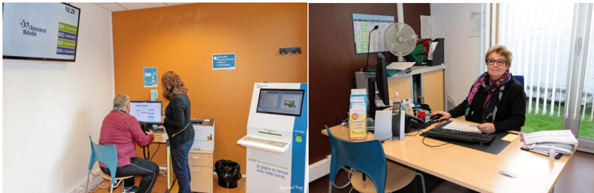
L'espace accueil et le bureau d'entretien

Une borne informatique est à votre disposition, un agent de la CPAM vous accompagne et vous guide dans son utilisation. Un second agent vous reçoit, sur rendez-vous, dans un bureau dédié.