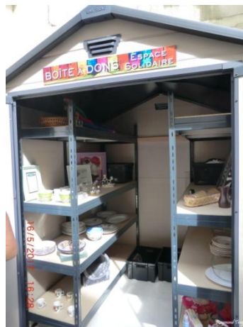
Boîte à don

A l'extérieur, un espace créé et géré par le Conseil citoyen : la boîte à don. Vous pouvez y accéder aux horaires d'ouverture. Le principe est d'y déposer les petits objets dont on ne se sert plus (hors livres et électronique) afin qu'un autre puisse prendre ce dont il a besoin.