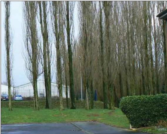
Promenade Sud :