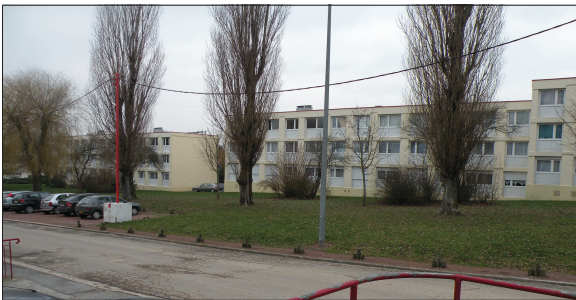
Rue Rabelais :